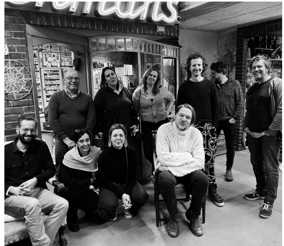
Groepsbezoek Museum Techniek met 'n Ziel